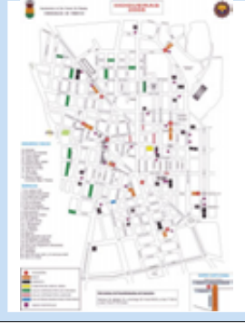
Dispositivo de Seguridad

08:00 h.: Despertá en todos los distritos con música y cohertería. 17:00 h.: BAÑÁ POPULAR, partiendo desde la Barraca ganadora del Primer Premio en el Concurso de Portaladas. 20:00 h.: Pasacalles en todos los distritos. 22:00 h.: Baile en todas las Barracas y Racós de Hogueras. 24:00 h.: CREMA DE LA HOGUERA OFICIAL DEL AYUNTAMIENTO, a continuación crema de todas las Hogueras de todos los distritos, comenzando con la del primer premio.